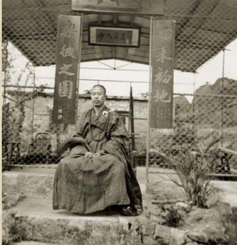
圖：1955年，上人攝於西樂園寺。

究竟她肚子裡是三個什麼怪物？告訴你們，是兩隻大壁虎，一隻大青蛙。爲什麼她會得到這種怪病？原來在她前生，曾遇著一個人，患了同樣的病。後來有位法師把那人治好了，並向她解釋，病人肚子裡三個怪物是