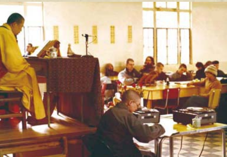
左上圖：1970年代，上人授課。