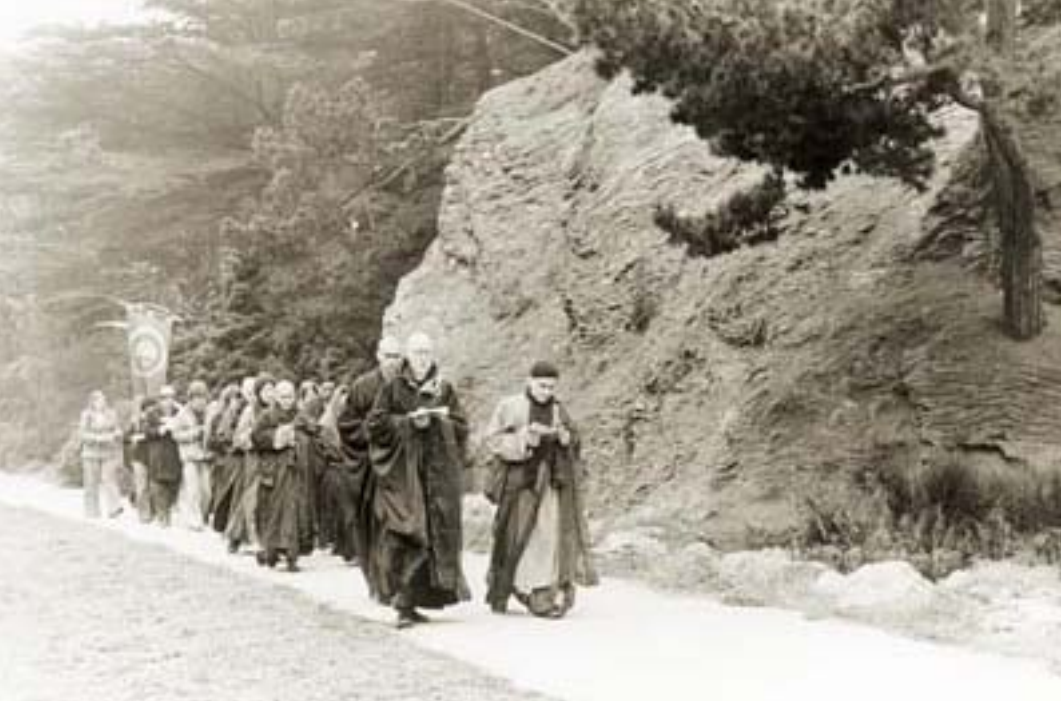
左上圖、右下圖： 1977年2月，於金門公園舉行「求雨法會」， 希望解除加州已持續兩 年的旱災。

若沒有德行，再好的風水也不能享用，那塊地也很可能從好變壞。所以說「德者本也，財者末也。」德行是根本，財富是末稍。一般人爭名奪利，你為何不爭著去充實自己？德行就是做利益他人的事，不單是利益一個兩個，而是饒益整體。所謂「道高龍虎伏，德重鬼神欽。」外立功，內修德，這樣如法修行，便很快圓滿菩提果位。