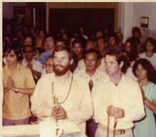
上圖：宣公上人拈香。