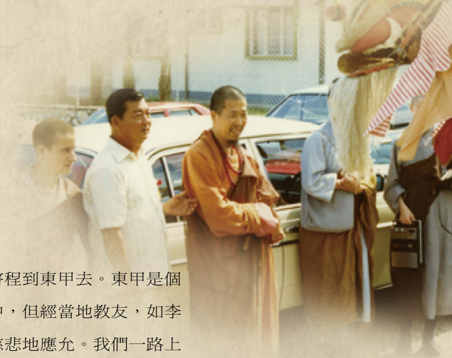
圖：妙應寺精采活潑的舞獅、敲鑼鳴鼓的熱烈歡迎。

到達東甲市政講堂，已有三百餘人齊集。上人首先開示三苦：「三苦是苦苦、壞苦、行苦。人生根本是苦多樂少，來到娑婆世間就是要還債，但一般眾生執迷不悟，看不破，放不下，終日沉醉於酒色財氣，被五欲的鎖鍊緊縛，毫無自由，這才是真苦啊！」